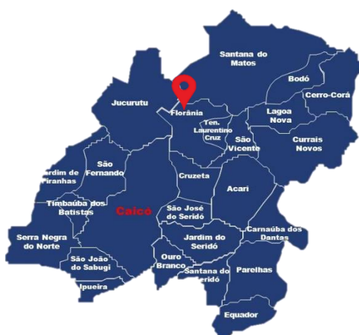
Figura 1 – Região do Seridó no Estado do Rio Grande do Norte